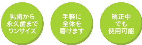
歯美ing 全く新しい歯ブラシの形